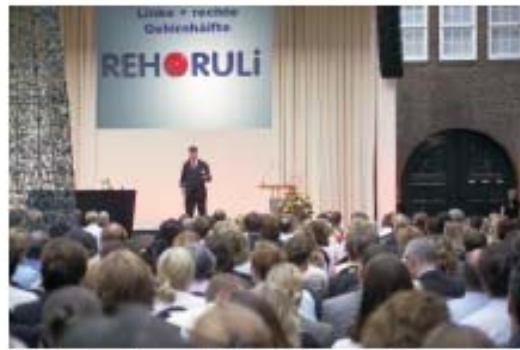
Joglieren lernen im Team Learn to Juggle in the Team Apprendre à jongler en équipe