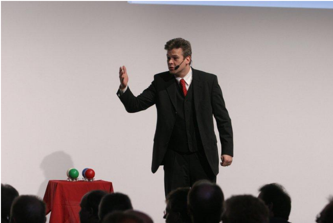
In vergnüglicher & seriöser Art.