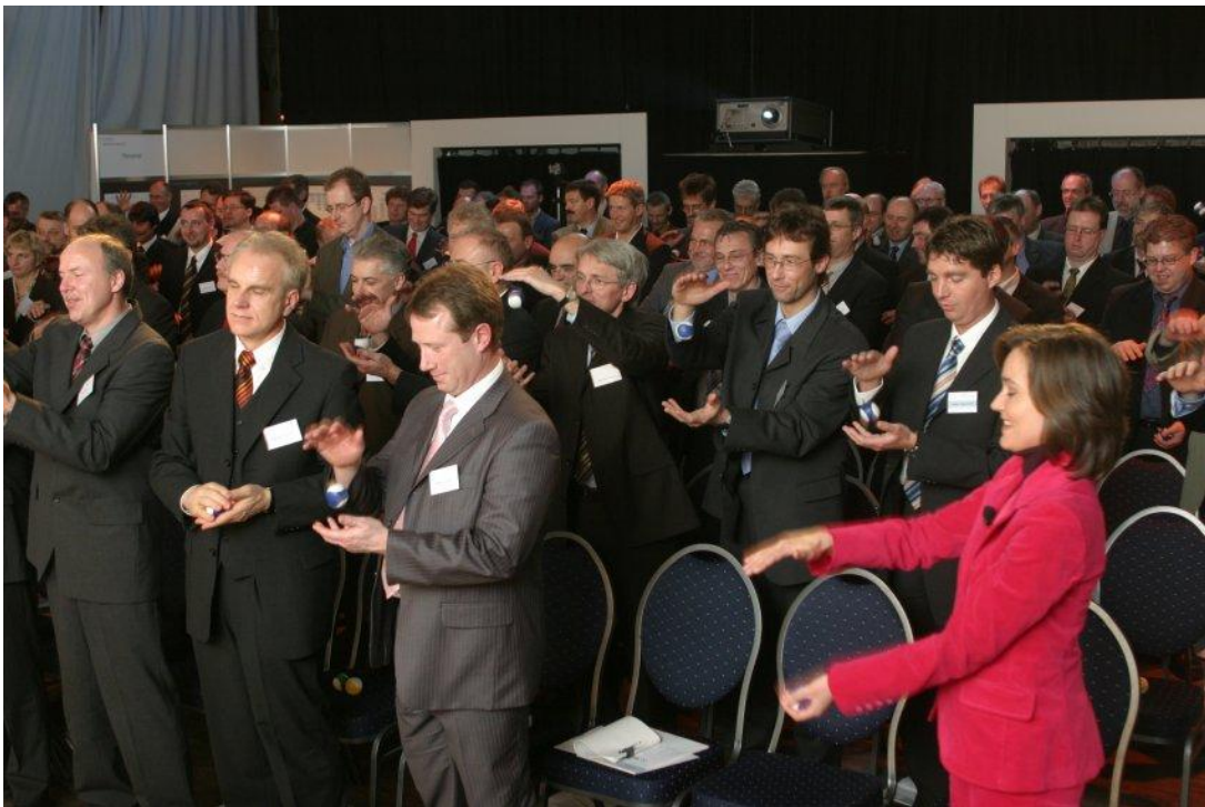
Das Publikum wird gleich zwei mal verblüfft. Als erste Überraschung finden die Mitarbeiter zwei Bälle unter dem Stuhl (geklebt). Die zweite Überraschung ist, dass nun alle aufstehen müssen und nun originelle Wurf- und Fangübungen damit machen ... passend zum Thema!