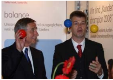
Wirtschaftsminister a.D Wolfgang Clement