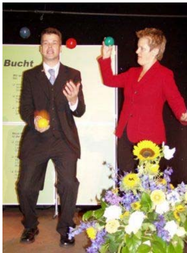
Bundesverbraucherministerin Renate Künast