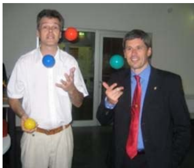
FIFA-Schiedsrichter Markus Merck